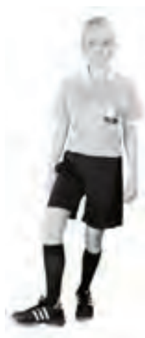
912 Otillåten spark (foten i vrishöjd, vriden utåt)