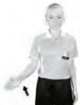
920 Hands (handflatan snett uppåt)