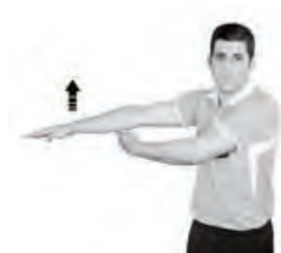
903 Lyftning av klubba (handflatan nedåt)