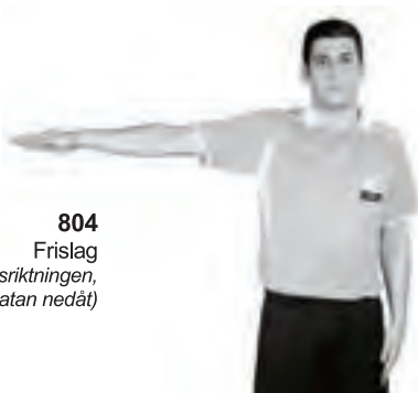
804 Frislag (armen vågrätt i fördelsriktningen, handflatan nedåt)