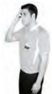
921 Nick (handflatan mot pannan)