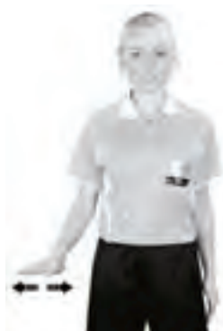
919 Liggande spel (handflatan nedåt)